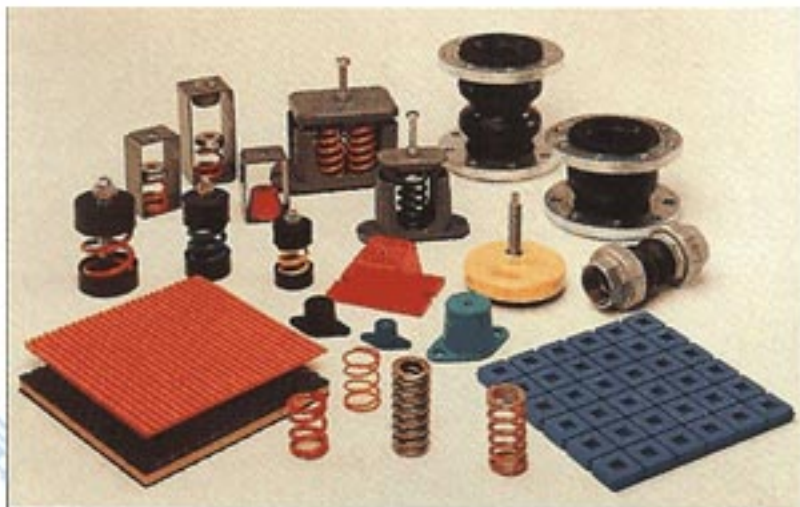
聲默橡膠及彈簧固定