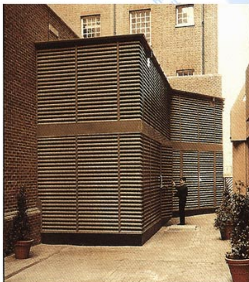
柴油發動機房的WLAC100鋼制百葉窗