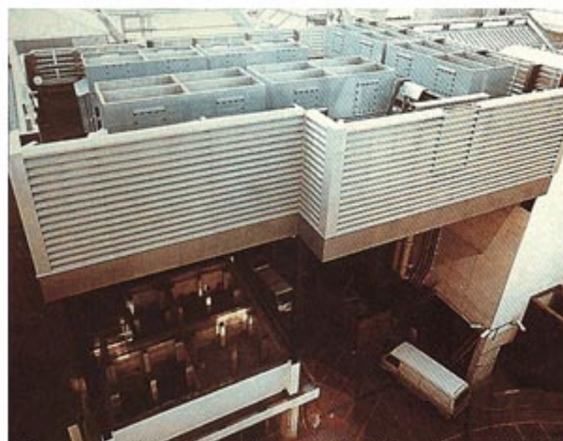
聲默LAAC30線條型隔聲百葉窗與三個大型冷卻塔