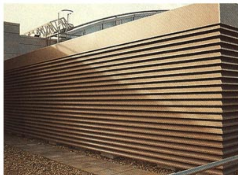
聲默WLAC簡約型隔聲百葉窗